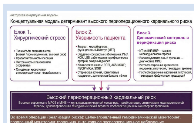
Рисунок 2. Концептуальная модель определения высокого периоперационного кардиального риска

По данным современных обзоров, более 50% пациентов старше 45 лет, подвергающихся несердечным операциям, имеют один или более факторов сердечно-сосудистого риска, что переводит их в категорию повышенного или высокого риска [5]. Примерно каждый пятый хирургический пациент относится к группе высокого периоперационного кардиального риска, а частота серьёзных осложнений (MACE, инфаркт, смерть) у них колеблется в пределах 4–10% после несердечных и до 20–30%