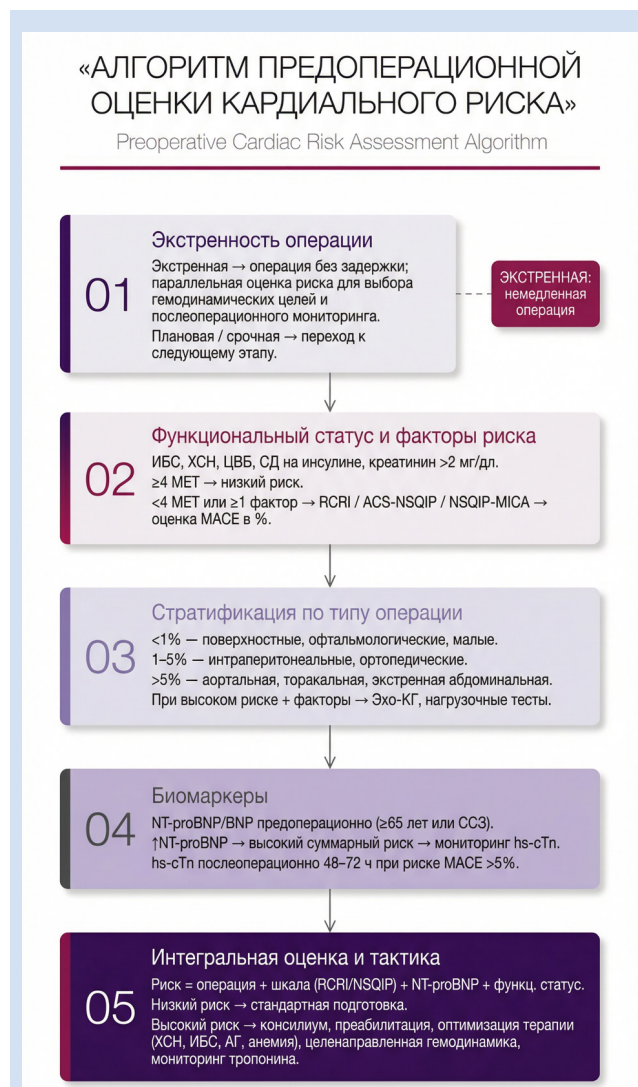
Рисунок 3. Алгоритм предоперационной кардиальной оценки Примечание: АГ – артериальная гипертензия; ИБС – ишемическая болезнь сердца; СД – сахарный диабет; ССЗ – сердечно-сосудистые заболевания; ХСН – хроническая сердечная недостаточность; ЦВБ – цереброваскулярная болезнь; ЭхоКГ – эхокардиография; MACE – серьезные неблагоприятные сердечно-сосудистые и церебральные события.

Решения по обследованию, подготовке, отмене/продолжению терапии, выбору техники операции – всегда персонализированы: под пациента и под операцию. Вовлечение мультидисциплинарной команды: кардиолог, анестезиолог, хирург, при